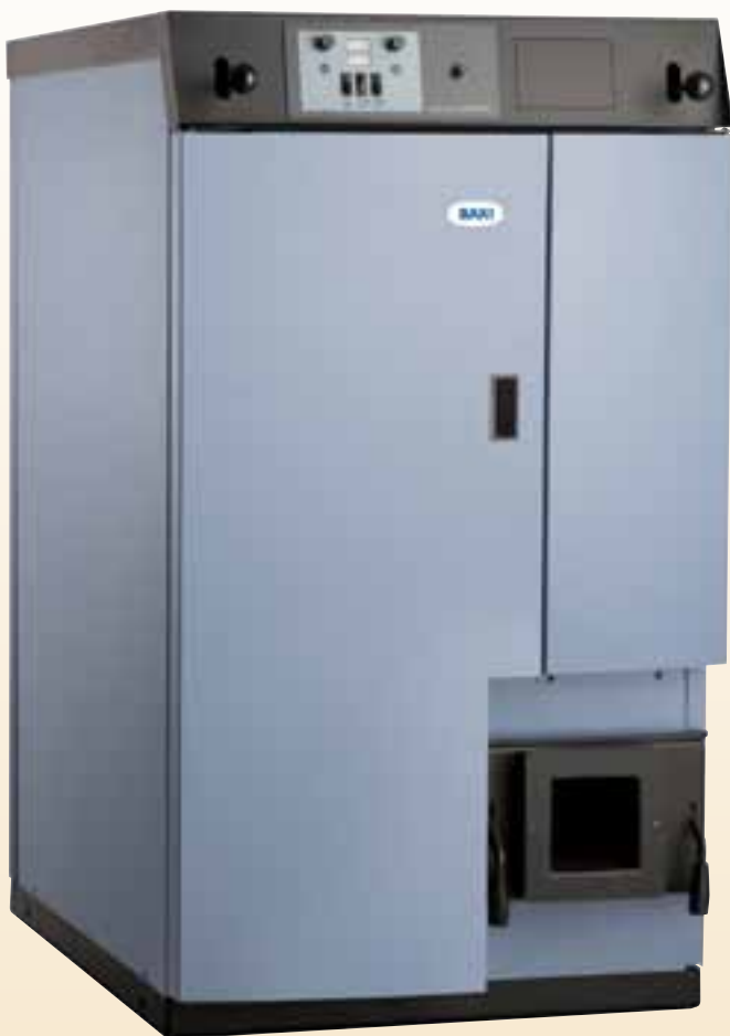
Her vist uden træpillebrænder